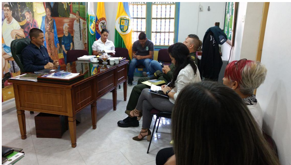
Consejo de Seguridad 25 de mayo de 2017 2:00 p.m.