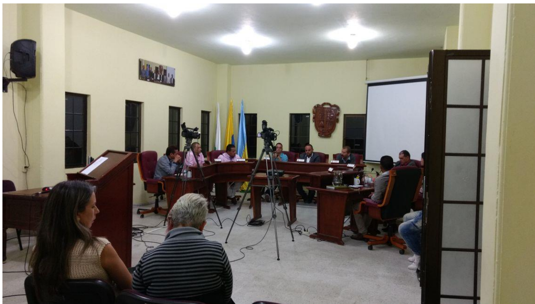
Informe de Gestión ante el Concejo Municipal 31 de mayo de 2017