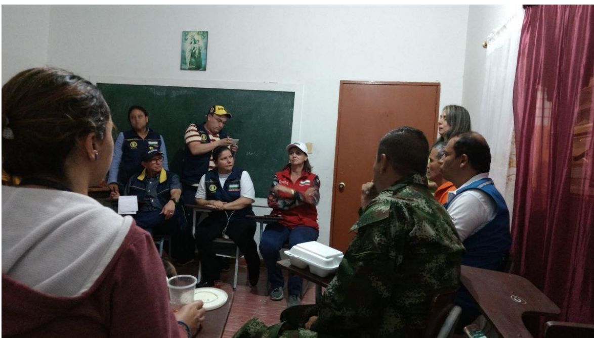
Apoyo a las familias víctimas del accidente del Barco el Almirante 25 de junio de 2017