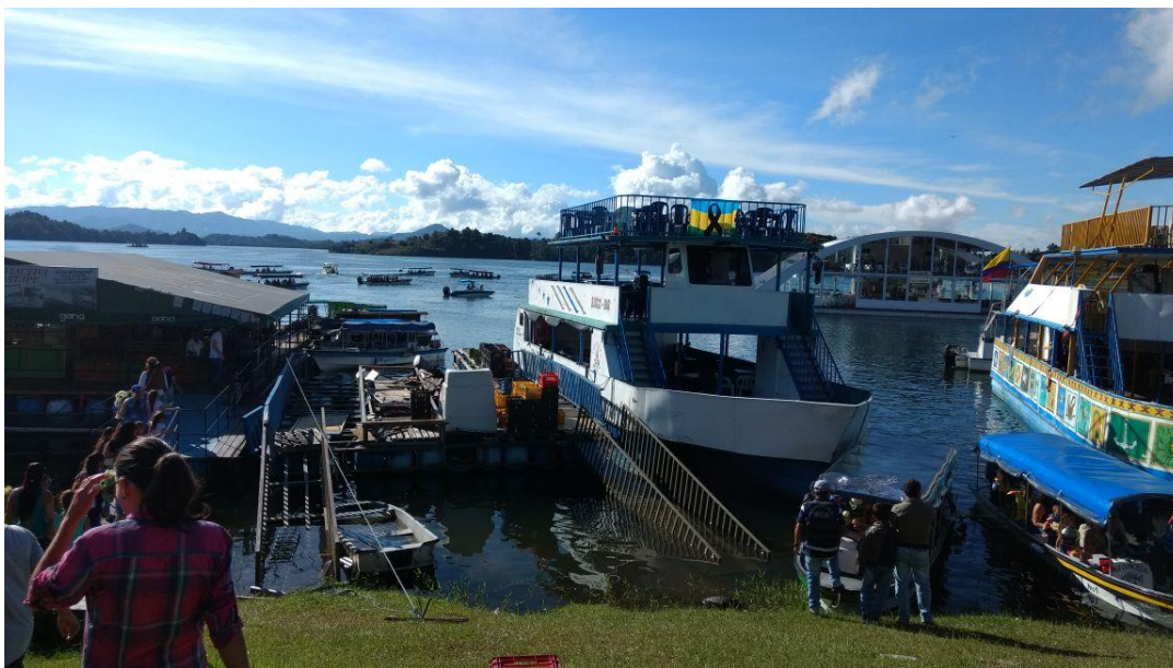
Participación en Homenaje a las Víctimas del hundimiento Barco el Almirante 30 de junio 3:30 p.m.