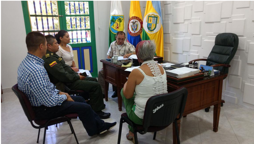
Instalación del Comité Electoral y Socialización Cronograma Electoral 06 de junio de 2017