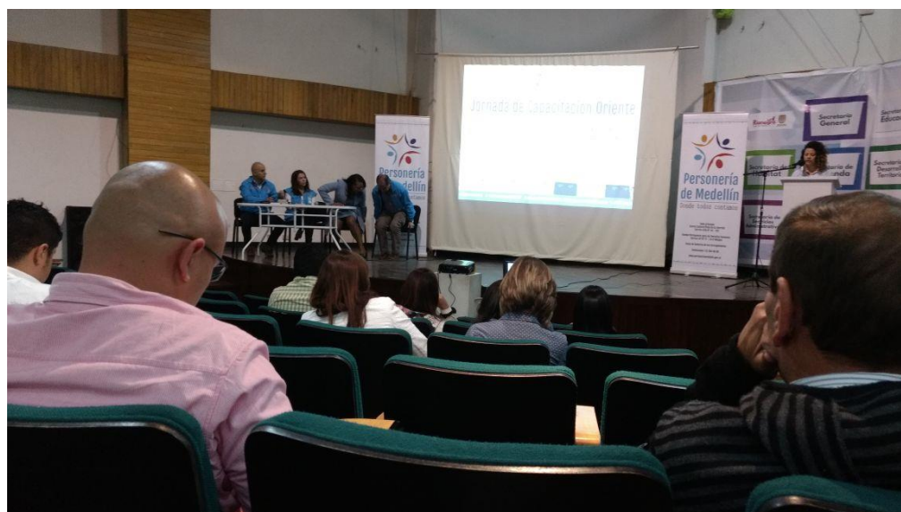
Capacitación sobre el Rol del Personero en Procesos Penales 30 de mayo de 2017