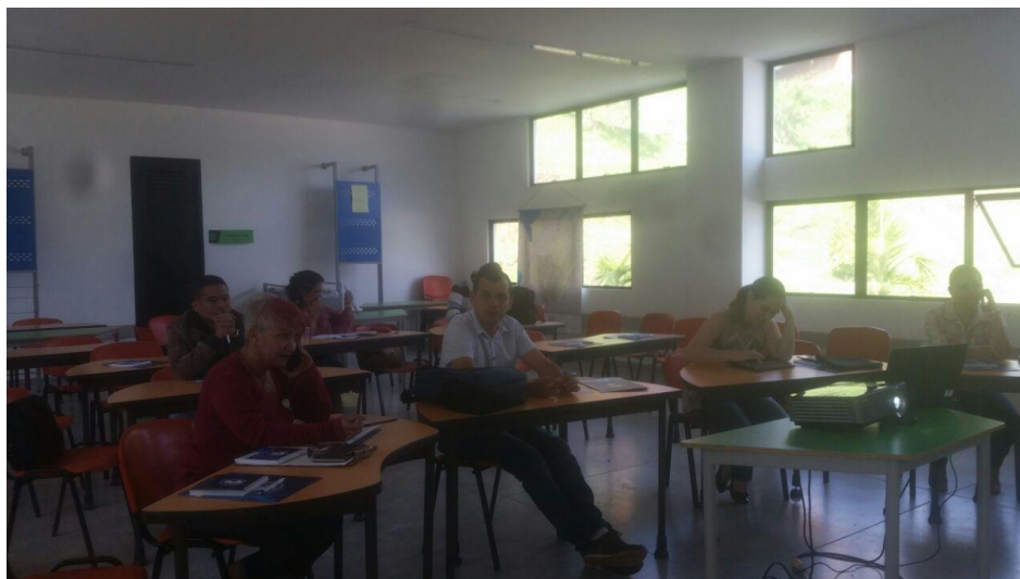
Seminario Contratación Estatal 24 y 25 de mayo de 2017 8:00 a.m. – 5:00 p.m.