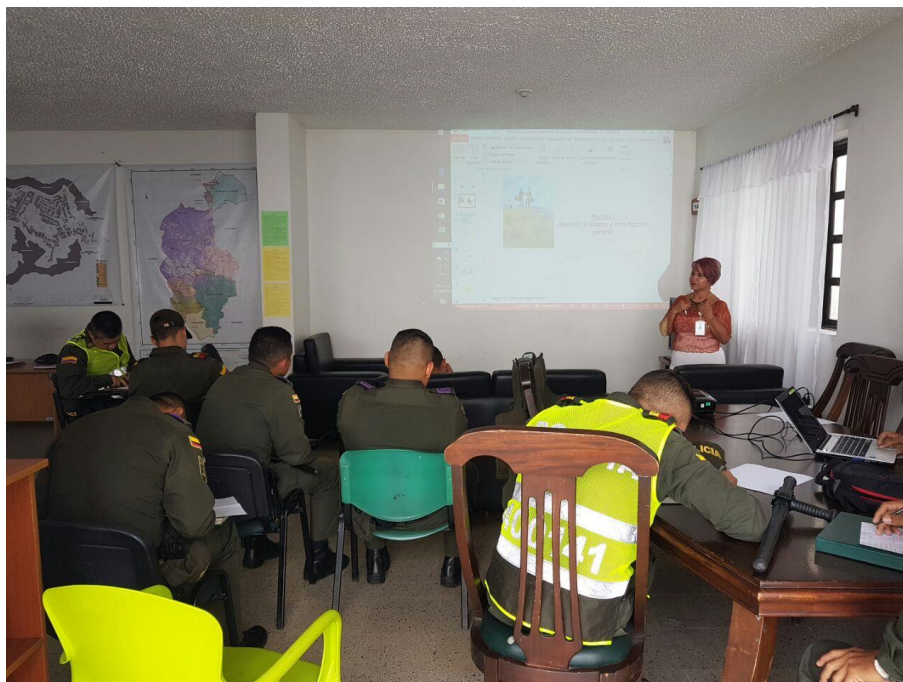
Capacitación al Comando de Policía 05 de junio de 2017 2:00 p.m.