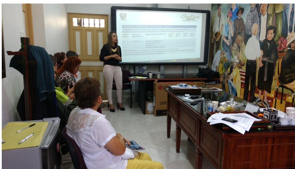
Comité Justicia Transicional 25 de mayo de 2017 10:00 a.m.