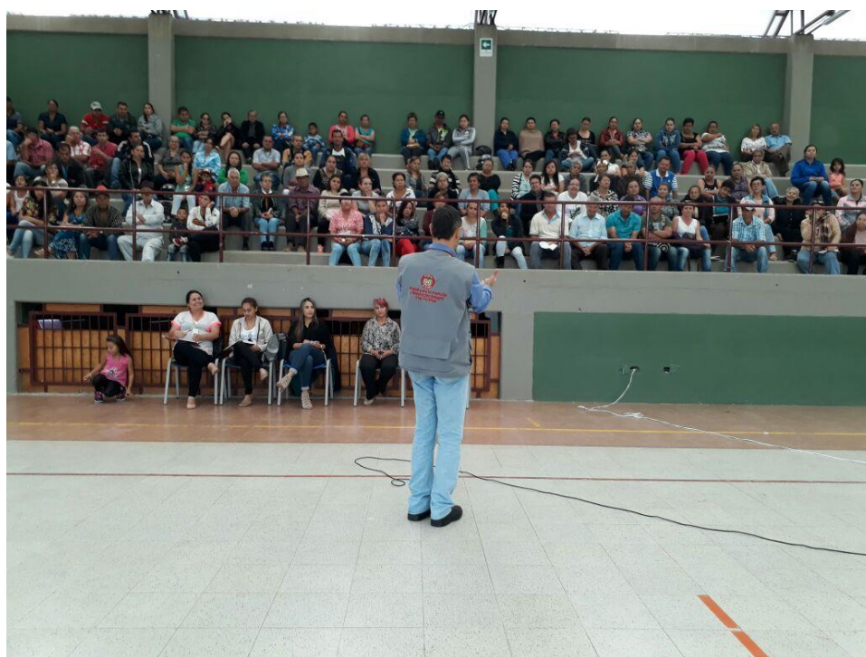
Fortalecimiento Capacitación Rutas de Atención y Reparación a las Víctimas del Conflicto Armado 15 de junio de 2017 9:00 a.m.