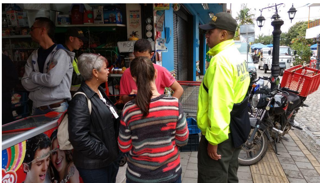
Operativo Trabajo Infantil 17 de junio de 2017