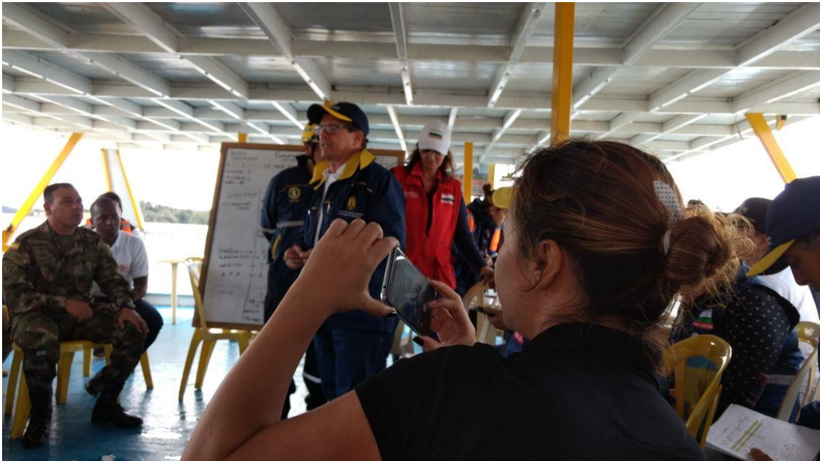
Apoyo a las instituciones y comunidad en la Tragedia de Asobarcos Guatapé 26 de junio de 2017