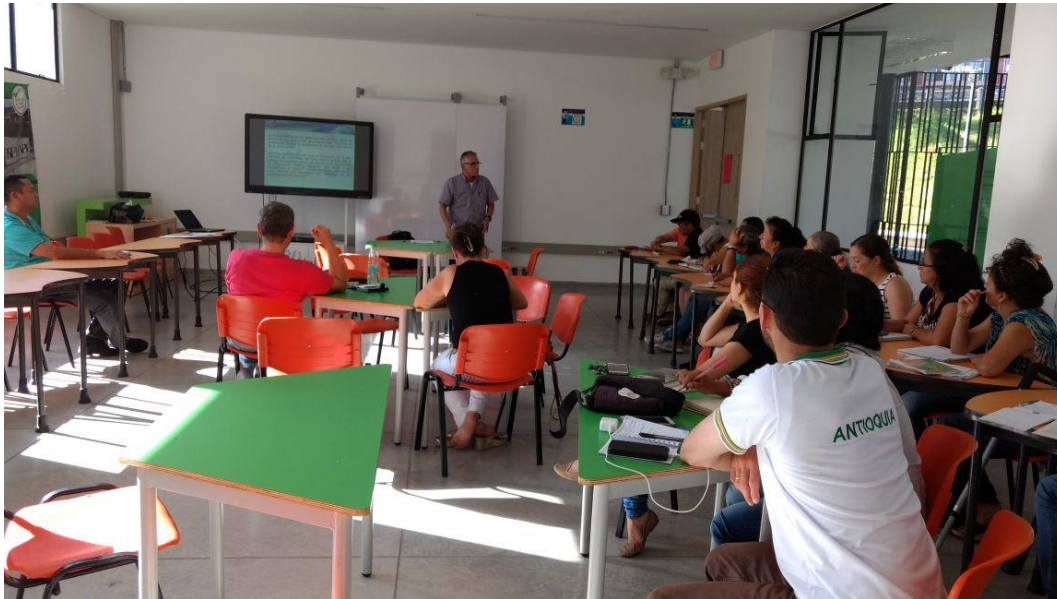
Seminario Control Social a la Gestión Pública Cuarto Módulo y Conformación de Veeduría Ciudadana para apoyar y fortalecer los planes, programas y proyectos de las víctimas del conflicto de Guatapé. 16 de junio de 2017 2:30-5:00 p.m.