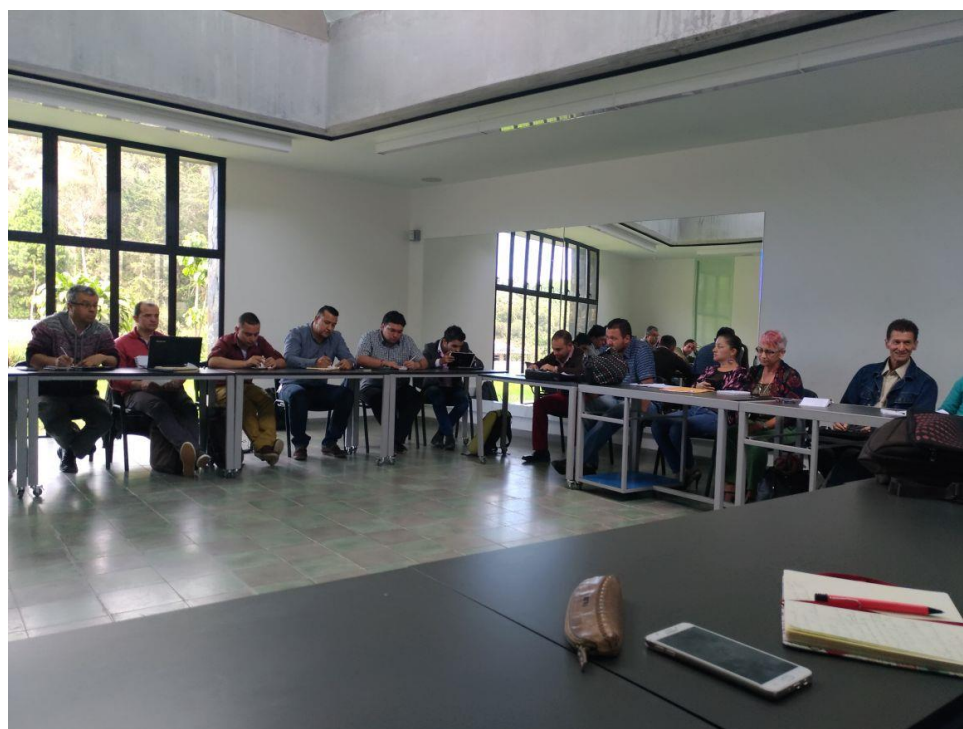
Reunión Comité Justicia Transicional con Procuraduría Provincial de Rionegro, Personeros del Oriente Antioqueño, y Unidad de Atención y Reparación Integral de Víctimas.