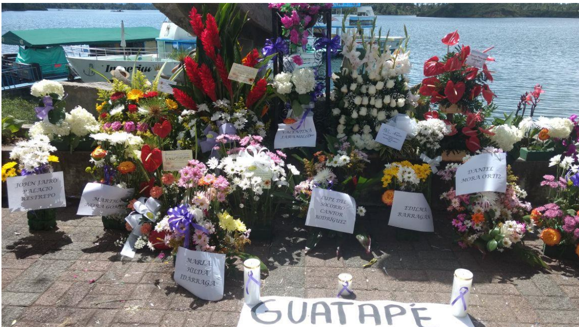
Homenaje a Víctimas de la accidente del Barco el Almirante 26 de junio de 2017