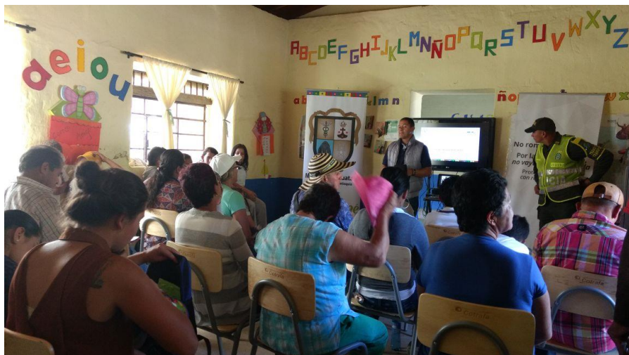
Personería Móvil Vereda la Peña 19 de mayo de 2017 8:30 a.m – 5:00 p.m.