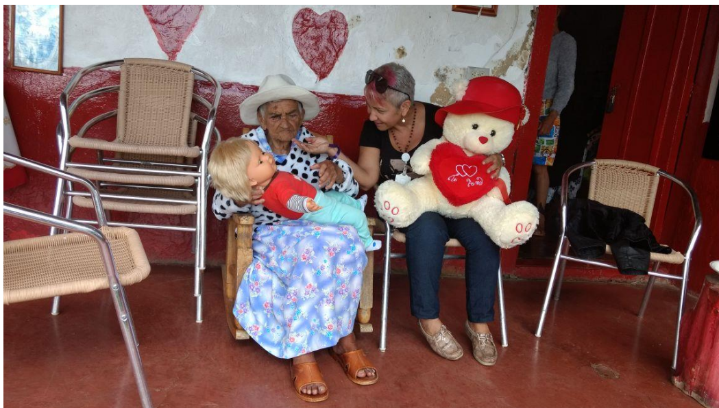
Visita Población Adulto Mayor Vereda el Roble 26 de junio de 2017