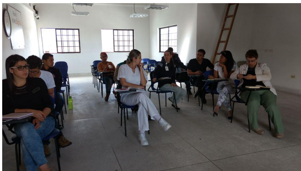
Reunión Mesa de Infancia y Adolescencia 23 de mayo de 2017 10:00 a.m.