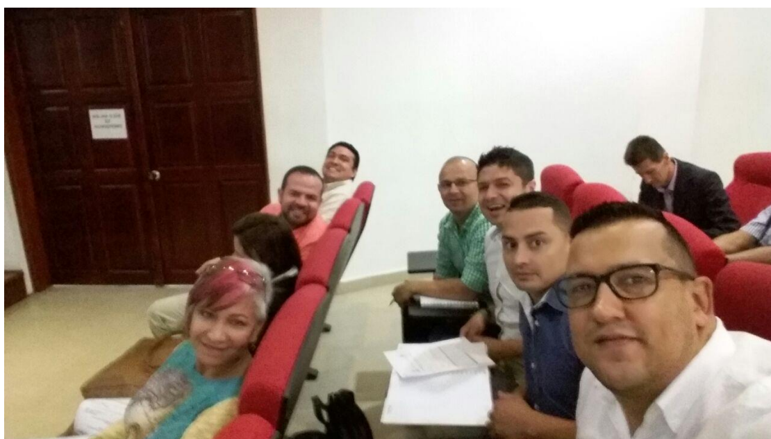
Capacitación Rol del Personero en la Convivencia Ciudadana 07, 08 y 09 de junio de 2017