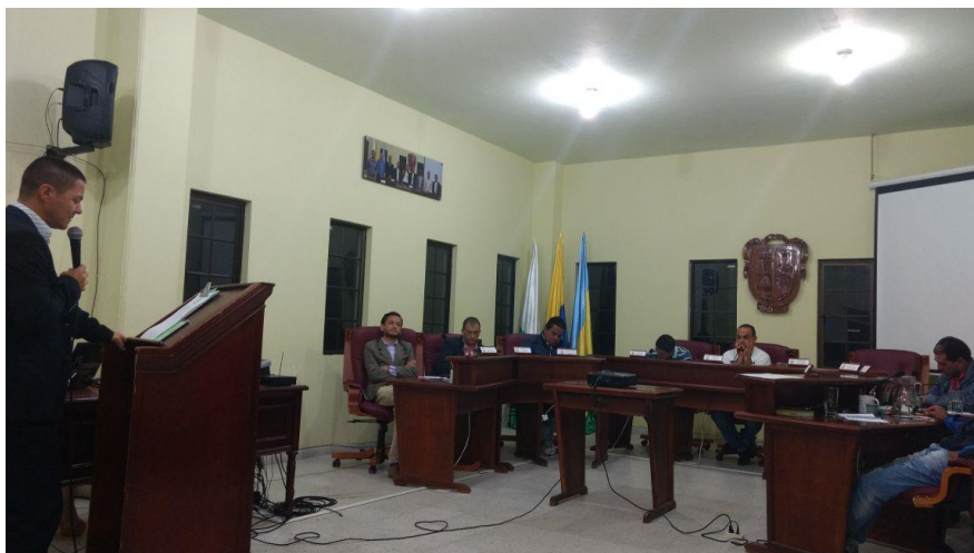
Invitada Concejo Municipal Tema – Seguridad del Municipio 17 de mayo de 2017 7:30 p.m.