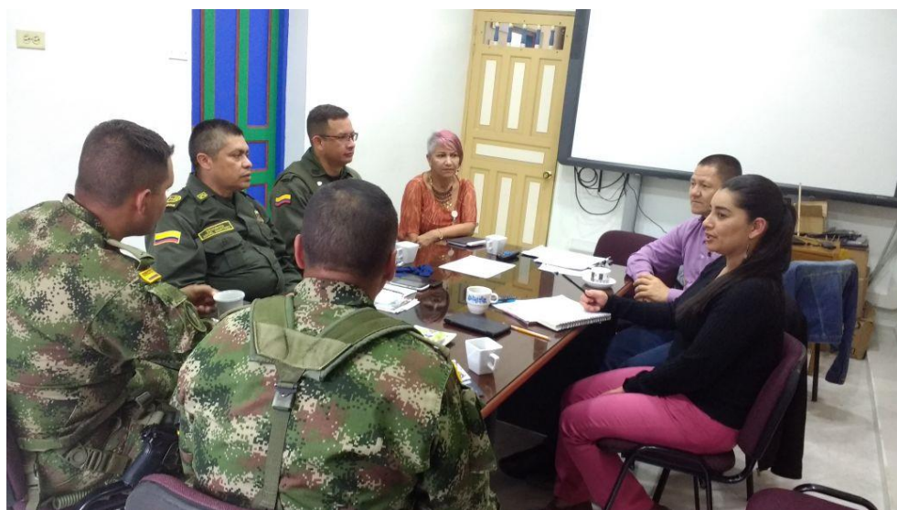
Consejo de Seguridad 05 de junio de 2017