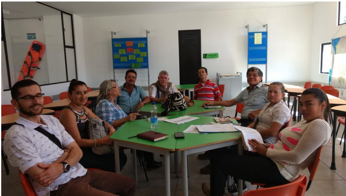
Capacitación ley 850 de 2003 Veedurías Ciudadanas Conformación de Veeduría Ciudadana para apoyar y fortalecer acciones para la disminución de la contaminación por vertimiento de aguas residuales domésticas en el área Rural del Municipio de Guatapé 30 de junio Parque Educativo 2:00 p.m.