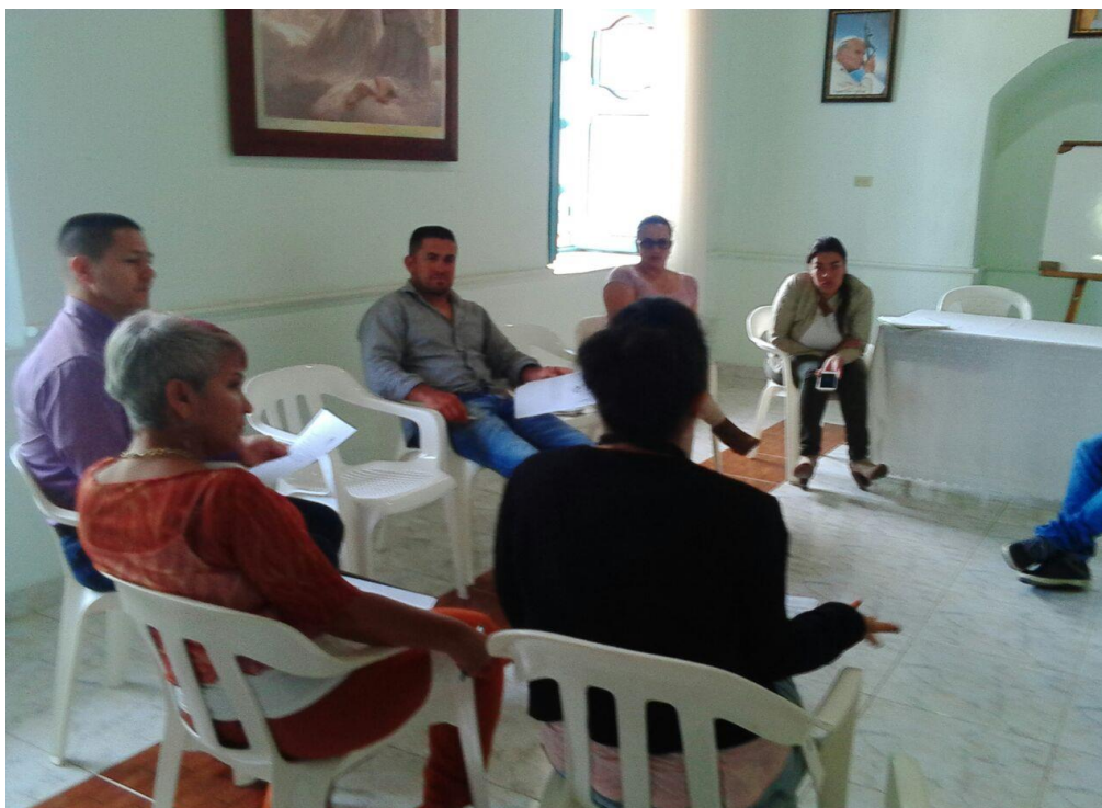
Reunión de Comité Protección Animal 05 de junio de 2017