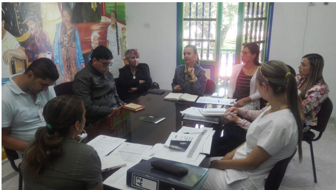
COVE 12 DE JUNIO DE 2017