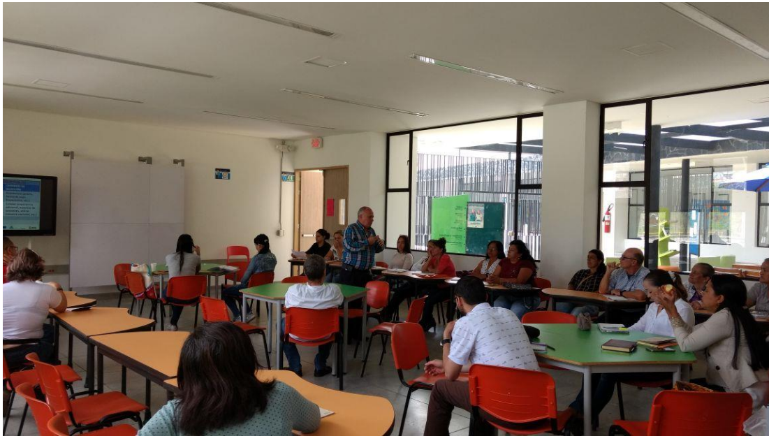
Seminario Control Social a la Gestión Pública Quinto Módulo 30 de junio 9:00 a.m – 12:30 p.m.