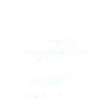
Fig. 2. Map of the study area showing the location of the sampling points (A, B, C, D, E, F, G, H, I, J, K, L, M, N, O, P, Q, R, S, T, U, V, W, X, Y, Z) and the distribution of the studied species.

The study area is located in the coastal zone of the Republic of Armenia, in the vicinity of the city of Yerevan. The area is characterized by a diverse topography, including mountains, hills, and valleys. The climate is continental, with hot summers and cold winters. The vegetation is mainly composed of deciduous and coniferous trees. The study area is rich in biodiversity, with a large number of plant and animal species. The study aims to investigate the distribution and abundance of various species in this area.