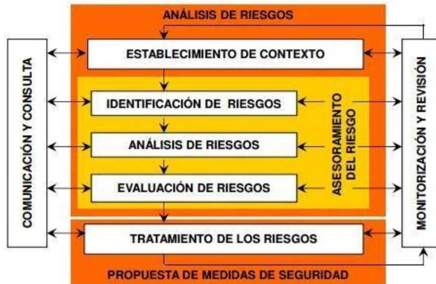
Figura 1 Proceso para la administración del riesgo.